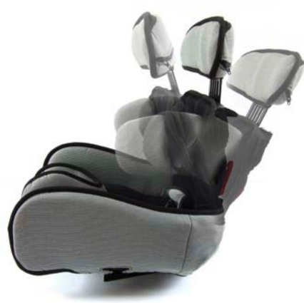
Dynamische, einstellbare Rückenlehne mit physiologischen Drehpunkten

Wir empfehlen Ihnen, die passende Hilfsmittelversorgung für Ihr Kind gemeinsam mit dem Facharzt, Therapeuten und Sanitätsfachhändler Ihres Vertrauens auszuwählen. Gerne unterstützen auch wir von interCo Sie vor Ort. Haben Sie Fragen, dann rufen Sie uns einfach an – wir helfen gerne!